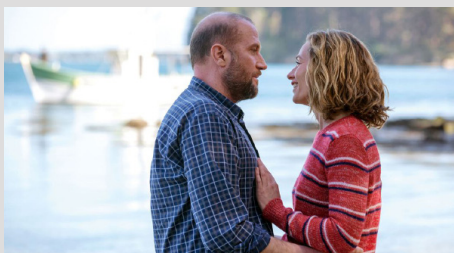
François Damiens et Cécile de France dans Otez moi d'un doute

Contact Cinémage - Christophe SALVAING 9, rue Réaumur - 75003 Paris 01 80 48 21 90 - csalvaing@cinemage.fr