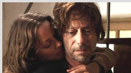
Marion Cotillard et Mathieu Amalric dans Les Fantômes d'Ismaël