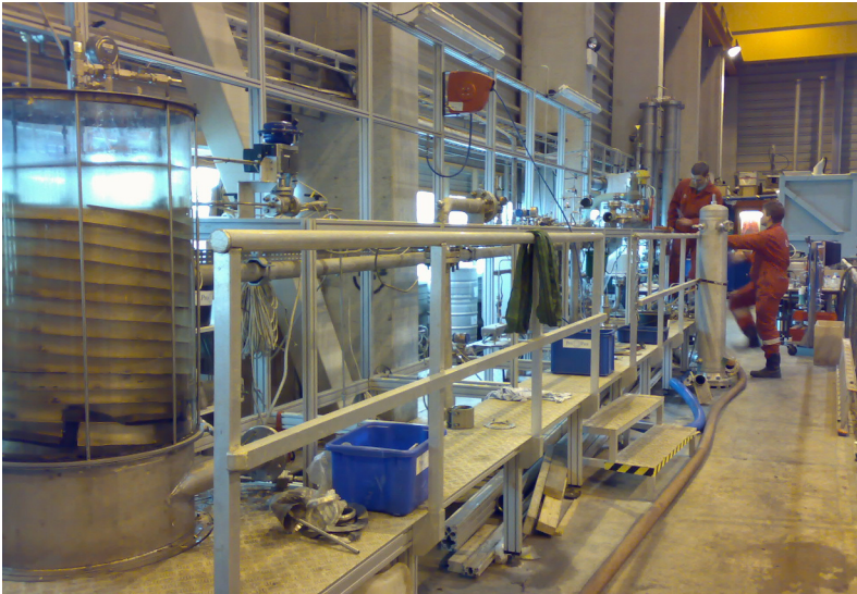
Assemblage de skids PROPURE au centre de recherche de ProSep en Norvège avant tests